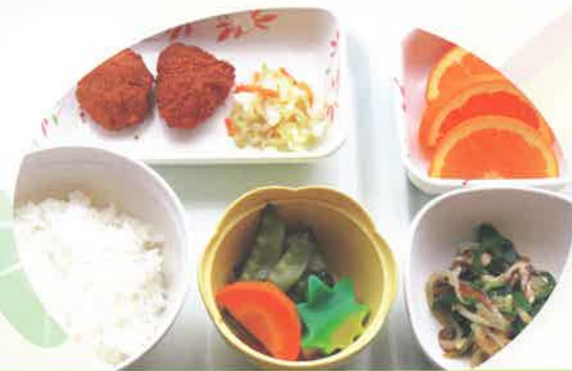
バランスのとれたお食事

★基本的に在宅療養可能な方を対象とします。 人員体制の都合でお受入できない場合があります。