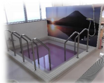
富士山をバックにゆっくりと入浴していただける大浴場

デイケアセンター太陽には3種類のお風呂があり、利用者様の身体状況に合わせて安心して入浴していただけます。