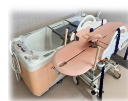
お身体の不自由な方でも安心して入浴して頂ける機械浴もあります