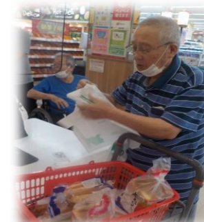
買い物リハビリ (10月)