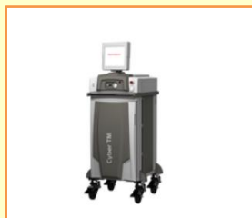
ツリウムヤグレーザー CyberTM

日本泌尿器科学会 専門医・指導医、 AMS社認定 PVP トレーナー（前立腺肥大症レーザー治療）