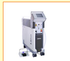
ホルミウムヤグレーザー QuantaLitho