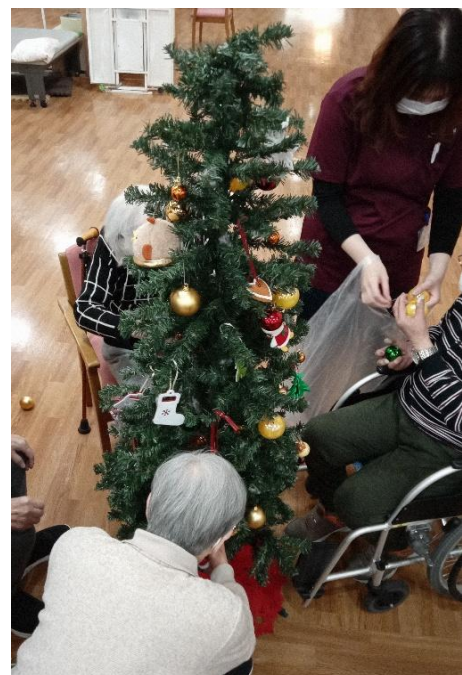
↑ クリスマス会で飾るツリーの 準備もみなさまで行いました♪