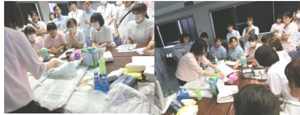
「オムツの有効な当て方」