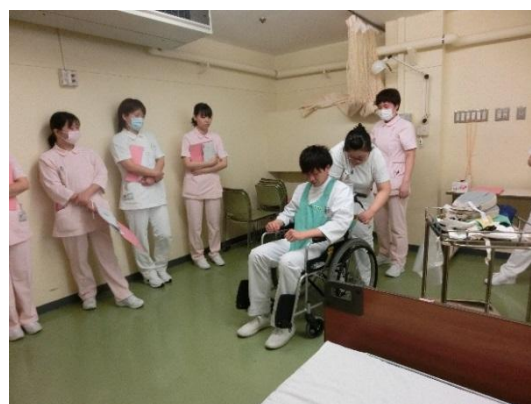
身体抑制について