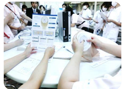
9/2 ストーマケア (各部署)