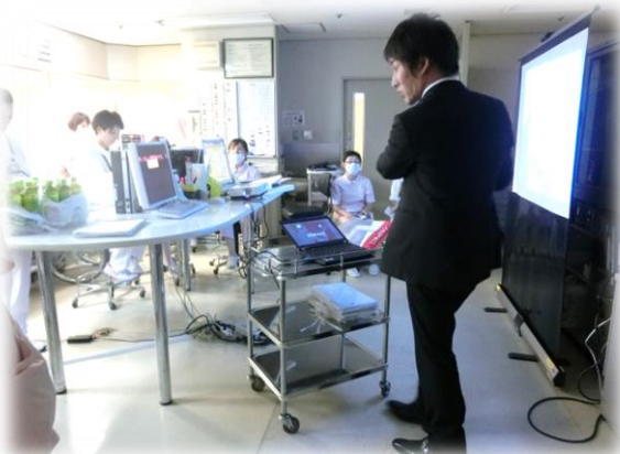
部署研修:テモダールについて3B病棟