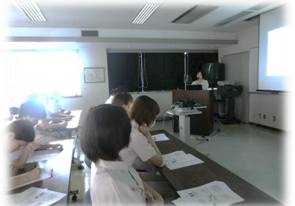
7/23 全体研修褥瘡予防研修