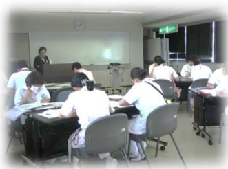
7/13 新人フォローアップ研修